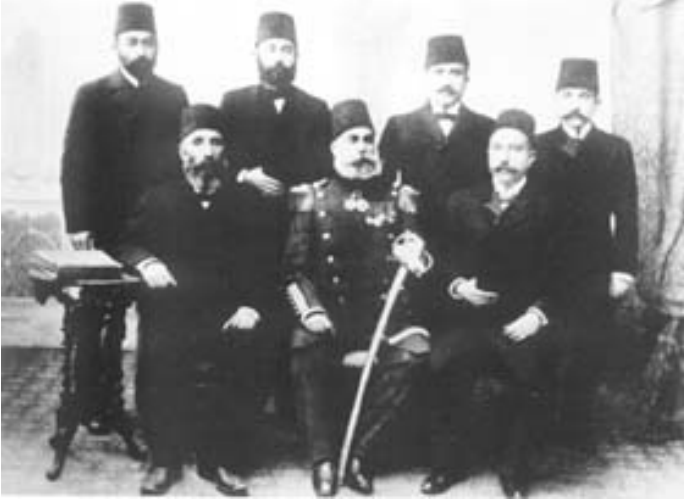
Şeyh Mahmut Berzenci (Önde Ortada)

düşünmüş ve kendini Kürt topraklarının Kral Faysal'ı olarak görmeye başlamıştır. Berzenci'nin bağımsızlık arayışı başka bazı Kürt aşiretleri tarafından da desteklenmiştir. 12