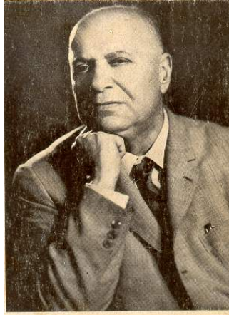
Şevket Süreyya Aydemir

Aydemir'in milli sol anlayışı süreçler içinde değerlendirilecek, Kemalizm'den Türk Sosyalizmi'ne söz konusu sol milli söylemin unsurları belirlenecektir. Sonuç bölümünde ise sol milli söylemin unsurları, koşullardan bağımsız bir biçimde genel hatlarıyla belirlenecektir.