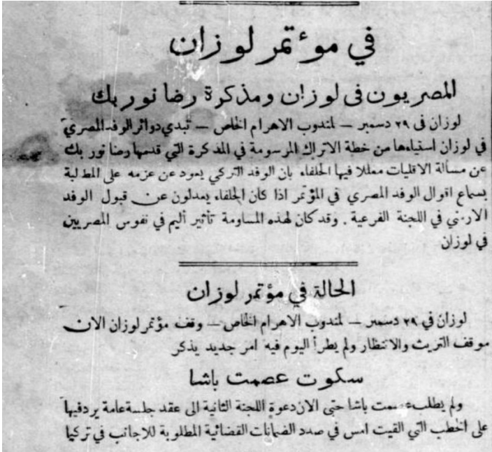
Ek 2- “Mısırlılar Lozan’da ve Rıza Nur Bey’in Açıklaması”, El-Abram , 30 Aralık 1922