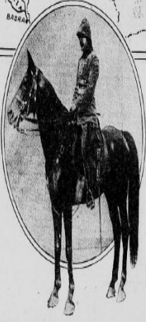
The Turkish adventurer is shown on horseback. The territory under his control is shown in shading on the map.

Enver Pasha, once the greatest of the Turkish revolutionaries, is now the name of the man who is to bring about the end of the Moslem rule in the East. It is very curious that the name of Enver Pasha, once the greatest of the Turkish revolutionaries, is now the name of the man who is to bring about the end of the Moslem rule in the East.