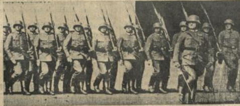
Alman ku'aları takım kolile yürüyüşte...