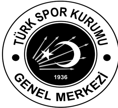
Görsel 2: Türk Spor Kurumu'nun logosu