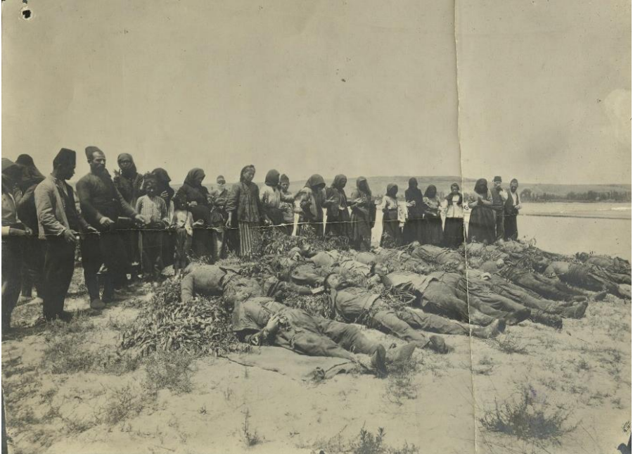
Ek-1. Bulgarlar tarafından katledilerek Arda Nehri'ne atılmış Müslümanların fotoğrafları. (BOA., BEO., 4203/315151)