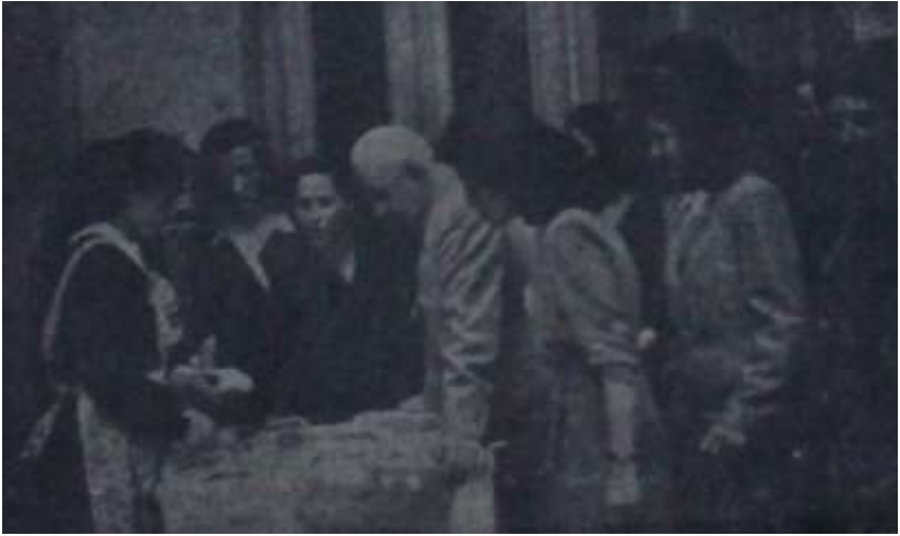
Ek 4- İnönü, 1945-1946 Ders Dönemi Sonunda Açılan Sergideki İşleri İncelerken Yeni yol , 2 Temmuz 1947 s.1.