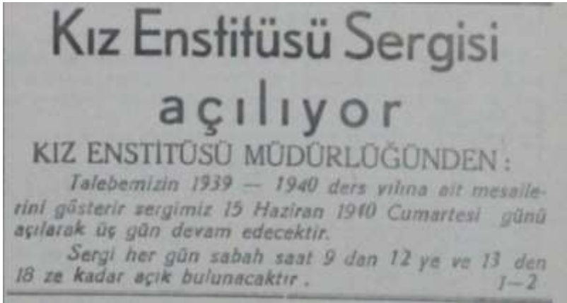
Ek 6- 1939-1940 Ders Dönemi Çalışmalarından Oluşan Serginin Açılış İlanı