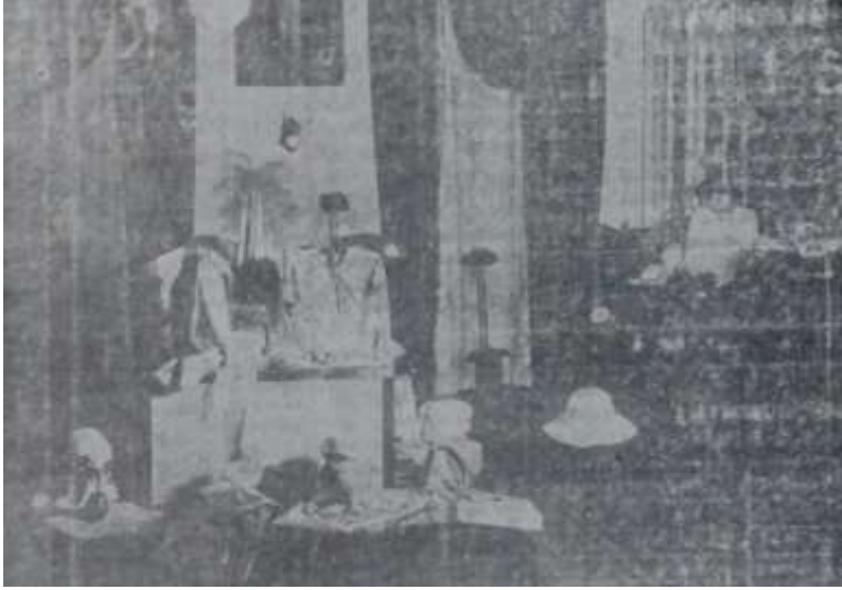
Ek 5- 1943-1944 Yılı Sergisinden Bir Köşe