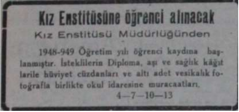
Ek 3- 1948-1949 Eğitim-Öğretim Yılına Kayıt Başvurusu İlanı Yeni yol , 4 Eylül 1948, s.2.