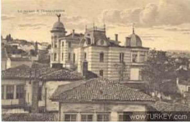
Ek 2- Trabzon Kız Enstitüsü'nün Hizmet Verdiği Bina Olan Kostaki Konağı

“Kostaki Konağı'nın Söyledikleri”, Mimarlığın Önsözü, 18 Ağustos 2017, https://mimarliginonsozu.wordpress.com/2017/08/17/kostaki-konagininsoyledikleri/ (Erişim Tarihi: 25 Aralık 2022)