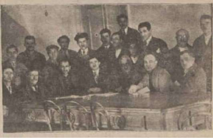
Ek 4 - 1 Nisan 1932 Tarihinde Düzenlenen Kongre