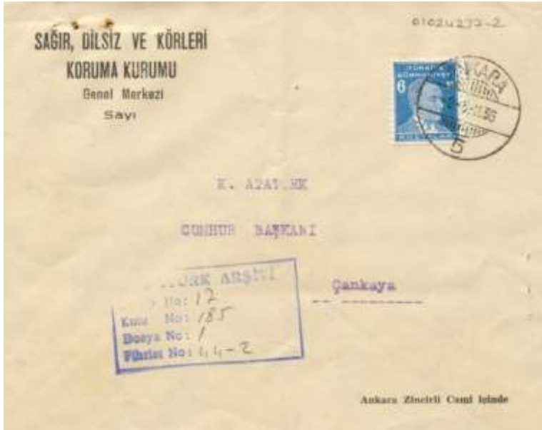
Ek-2 Atatürk'e Gönderilen Yardım Balosu Davetiyesi Cumhurbaşkanlığı Arşivi (01024237-2)