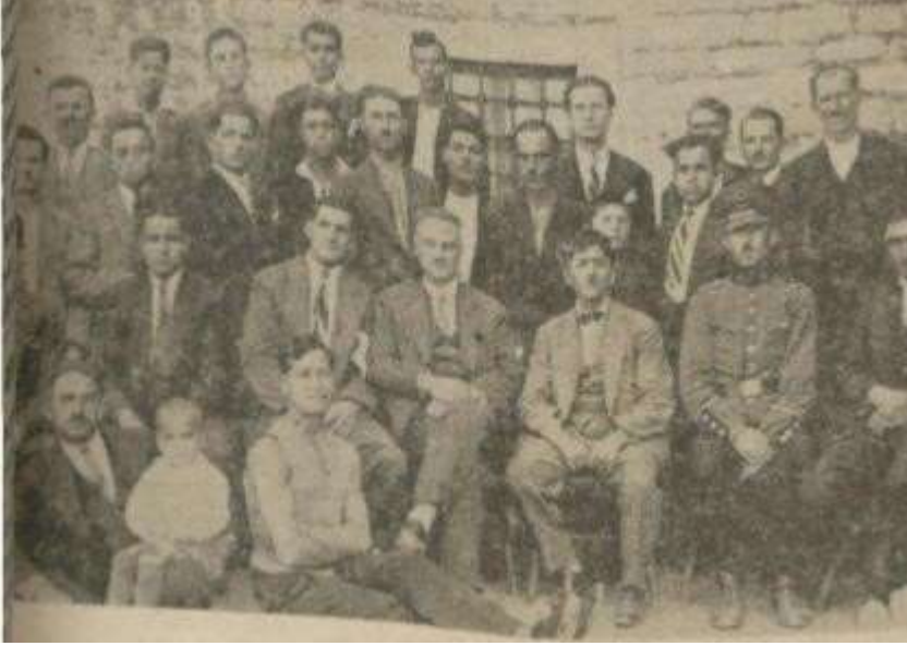
Ek 5 - İstanbul Dilsiz Cemiyeti'nin İlk Toplantısı