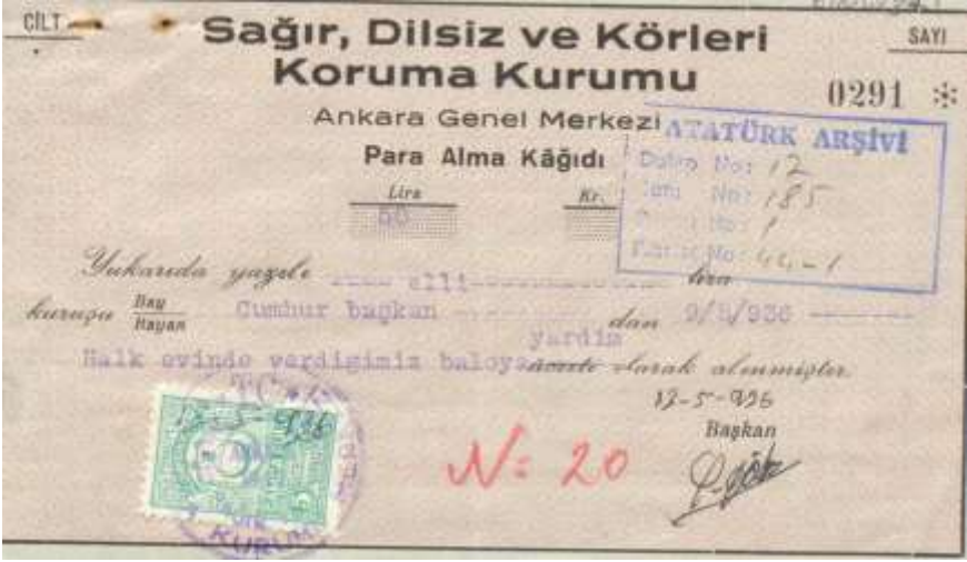
Ek 3- Atatürk'ün Yardım Balosu Dolayısıyla 50 Liralık Yardımı Cumhurbaşkanlığı Arşivi (0102423371)