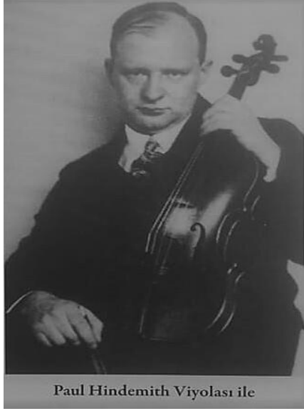
Paul Hindemith Viyolası ile