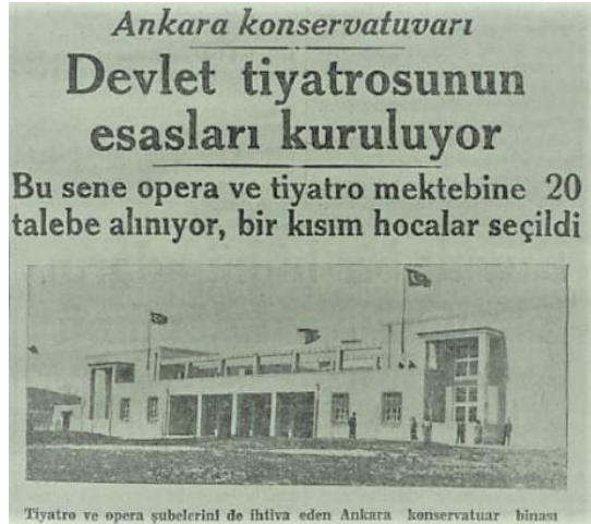
Ek 6- Ankara Devlet Konservatuvarının Binası (1936)

(“Ankara Konservatuvarı”, Akşam , 9 Teşrinievvel 1936.)