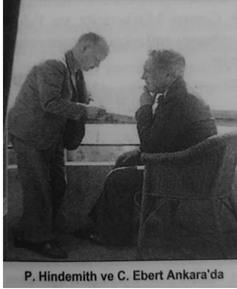
P. Hindemith ve C. Ebert Ankara'da