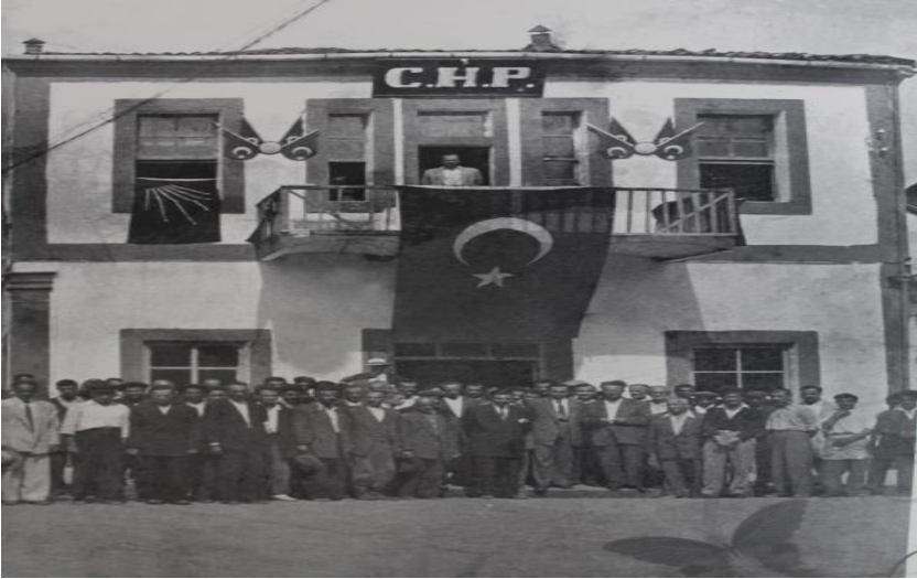
Resim 2. Rize CHP Binası.

(Fatih Sultan Kar, Evvel Zaman İçinde Rize, Rize Vitrini Ajans, İstanbul, 2010, s.151. )