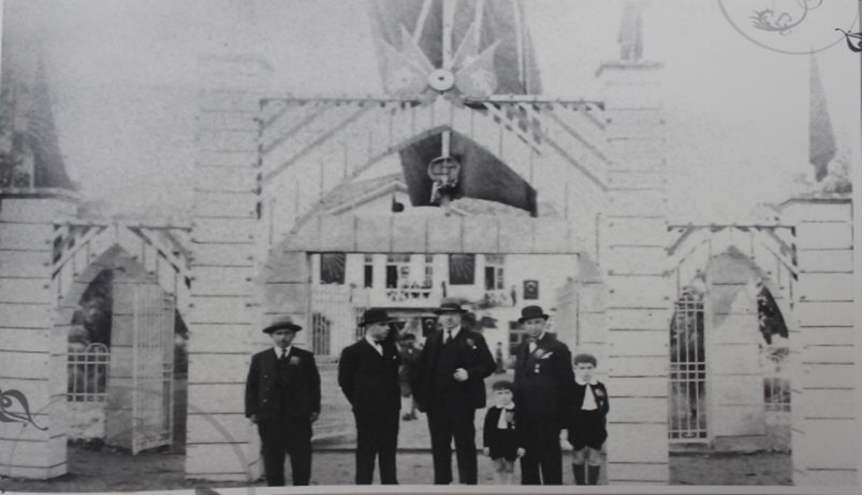
Resim 1. Rize Halkevi Binası.

(Fatih Sultan Kar, Evvel Zaman İçinde Rize, Rize Vitrini Ajans, İstanbul, 2010, s.151. )