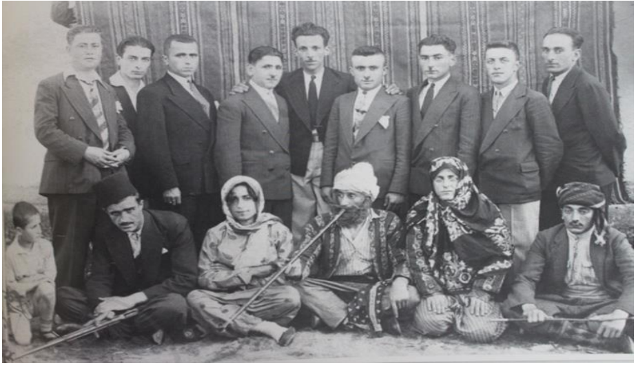
Resim 3. Rize Halkevi, Temsil Şubesi. (Kar, age., s. 261)