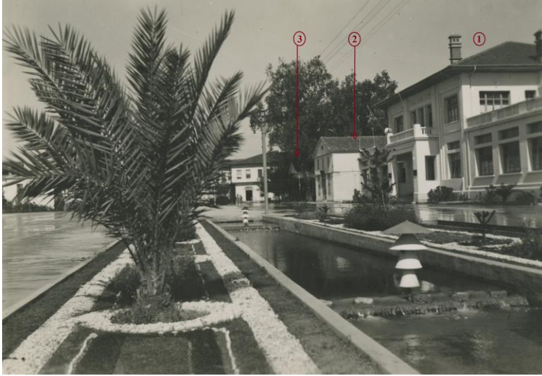
Resim VI-a 1) Antalya Halkevi, 2) Leyla Sineması ve 3) Vatan Kırathanesi.