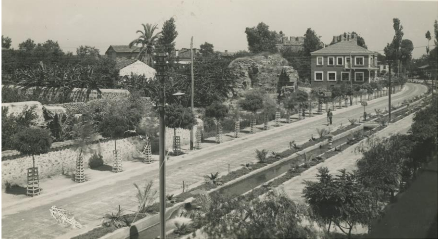
Resim III. Atatürk Caddesi (Kaynak: Yazarın kişisel arşivi).