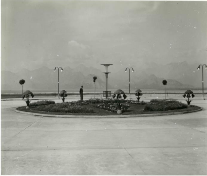
Resim IV. Gazi Bulvarı ve Karaaliođlu Parkı I. Mirador.