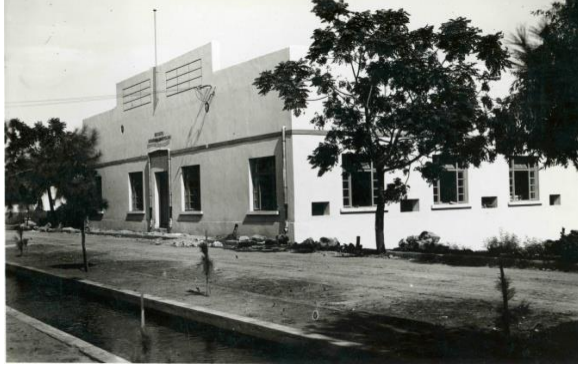
Resim II. Cumhuriyet'in "yapıcı elinin" kübik bir üslupla inşa ettiği Ali Çetinkaya Caddesi üzerindeki modern hal ve soğuk hava deposu.