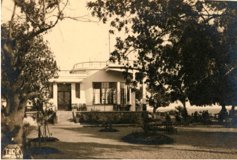
Resim VI – b Park Gazinosu (Kaynak: Yazarın kişisel arşivi).