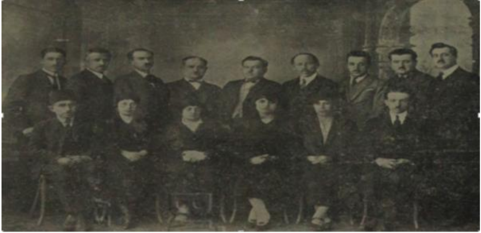
Ek-1 İstanbul Muallimler Cemiyeti 1924-1925 Senesi İdare Heyeti 58