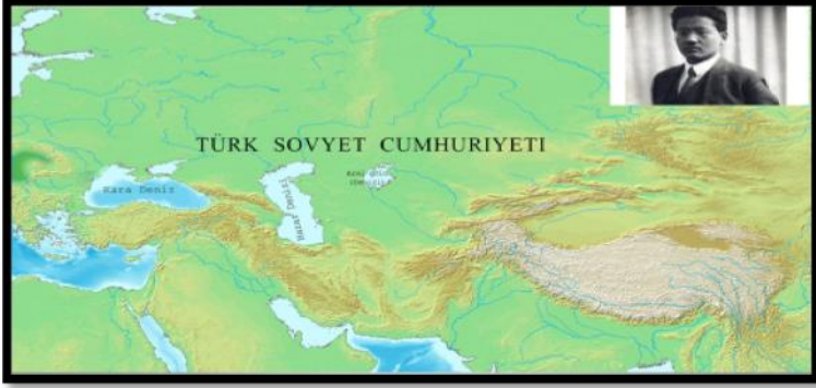
Harita 1-Turar Rıskulov'un Tasarladığı Devletin sınırları 39

Anlatılan mesele Turar Rıskulov'un görüşlerini destekleyen diğer Sovyetler Birliği Türk halkları arasında da sayıca az değildi. Mesela Başkurt Millî Hareketi lideri A. Zeki Velidi, Başkurtistan'ın Sovyetler Birliği Hükümetinin desteği ile Başkurtistan Millî Egemenliğini alacağına inanarak 1919 yılı Başkurt İhtilalci Komitesine dahil oldu ve 1920'de Komite'nin Başkanlığına getirildi. Ancak Bolşeviklerin açık saldırılarına uğrayan Zeki Velidi ve arkadaşları aynı yılın Haziran ayında gizlice Türkistan'a gitmeye ve Basmacılarla ve onları desteklemek üzere Türkiye'den gelen Enver Paşa ile anlaşmak yolunu seçtiler. 40 Kendisinin Bolşeviklere olan hoşnutsuzluğunu Lenin'e gönderdiği mektubunda Zeki Velidi açıkça dile getirerek şunları yazdı: