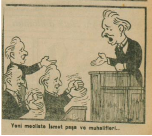
Yarın , 27 Nisan 1931, s. 1.

Ülkedeki ekonomik istikrarsızlığın en önemli sebebini Tek Fırka sisteminde gören Yarın 'a göre Büyük Buhran bahane olarak öne sürülmektedir. Gazeteye göre bunun en bariz örneği ise Türkiye ile mevcut gelişmesi aynı seviyede olan Bulgaristan ve Yunanistan'ın kaydettiği ilerlemedir: