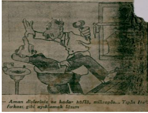
Yılmaz, 1 Şubat 1931, s. 1.

Devletin yönetim sistemi bakımından; "Bir Devlet Nasıl İdare Olunur?" başlıklı makalede neden bir muhalefet partisine ihtiyaç olduğu dönemin mevcut sistemleri üzerinden değerlendirmekte ve demokrasinin hüküm sürdüğü bir memleketin Faşist ya da Bolşevik sistemlerden farklı olması gerektiği özellikle savunulmaktadır: