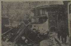
Gerede seldinceden bir görünüş

Ankara, 6 (Hassat) — Kamelli zeminde bulunan, bu sabah saat 12.5 de kayırdığı ve İstanbul'da meydana gelen 200 kilometre olanın, İstanbul'da meydana gelen merkez deprem Ayvalık ve çevresinde meydana geldi. Bu deprem sırasında birçok bina ve yapılar yıkıldı. Bu deprem sırasında birçok bina ve yapılar yıkıldı.