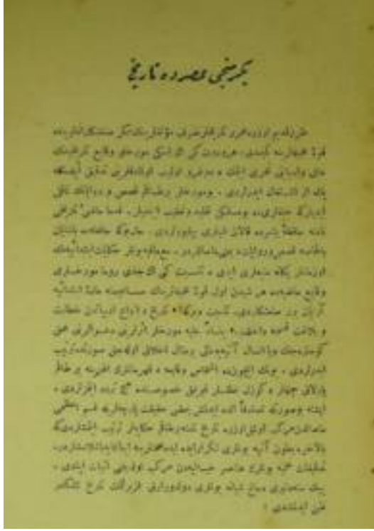
Resim-1. Ahmet Şuayp, “Yirminci Asırda Tarih”, Ulum-ı İktisadiye ve İctimaiyye Mecmuası , S. 1, 15 Kanun-ı Evvel 1324 (28 Aralık 1908), s. 20.

yargılarını ve metafizik söylemleri kabul etmeyen nesnel bir araştırma disiplini dir. 30