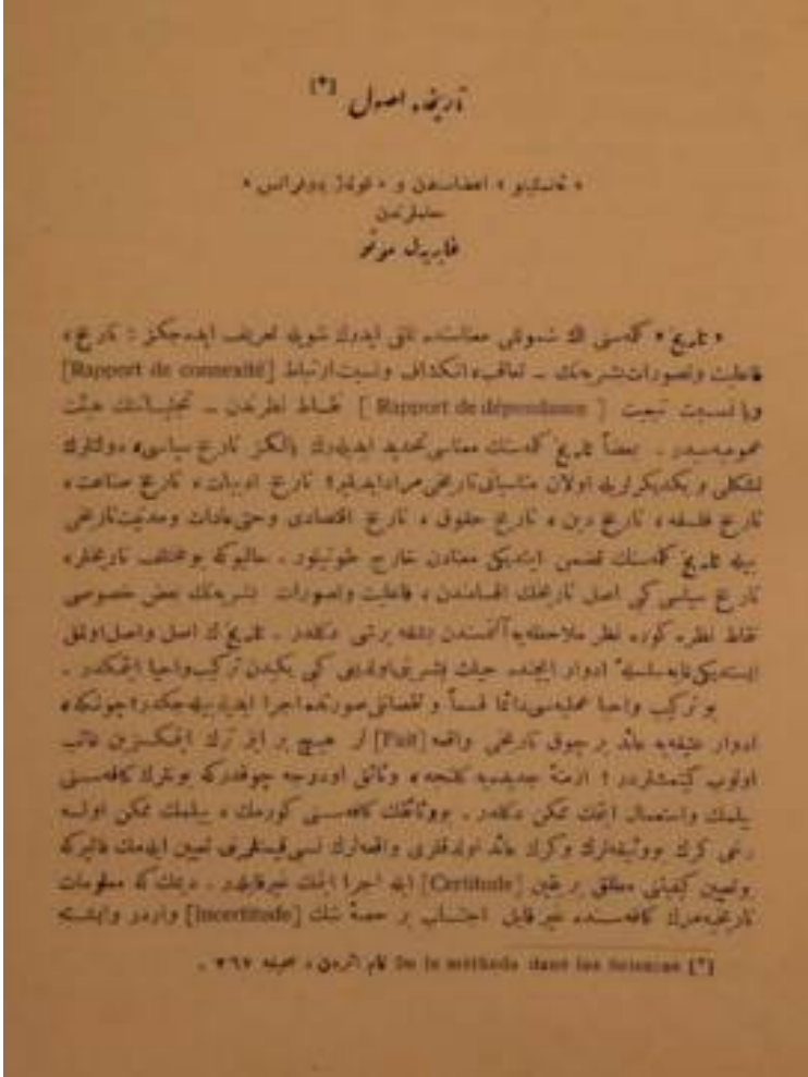
Resim-2. Gabriel Monod, “Tarihte Usul-P”, Darülfünun Edebiyat Fakültesi Mecmuası , S. 3, Temmuz 1332 (Temmuz/Ağustos 1916), s. 341.

oynayanların üstün zekâları ile değil güçlü hisleri ile başarılı oldukları unutulmamalıdır. 37