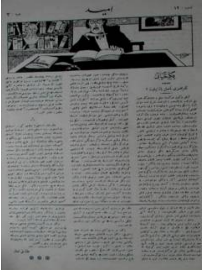
Resim-3. Köprülüzade Mehmet Fuat, “Tarihimizi Nasıl Yazmalıyız”, Ümid , S. 12, 21 Teşrin-i Evvel 1336 (21 Ekim 1920), s. 4.

XIX. yüzyıla kadar tarihçiler için tarih, siyaset ya da anayasa tarihi olduğundan siyasi yapı hakkında belli bir kanaate ulaşmak yeterliydi. Bu Ortodoks tarih, daha çok politika ile özellikle de ulus-devletlerin dış politikaları ile ilgi olup büyük adamlara odaklanmaktaydı. Buna göre geçmişin bütün diğer kanalları politik kararların malzemesini oluşturmaktaydı. 76 Julien Freund'e (1921-1993) göre XIX. yüzyılın tarihçiliği XVIII. yüzyılın rasyonalizminden farklı olarak entelektüel kuruluşların soyutlanmasını kabul etmiyor, bireyselliğin gelişmesi paralelinde milletin ya da halkın ruhunu realitenin bir anlamı olarak onaylıyordu. 77 Ancak tarih araştırmalarının kapsamında ve hacminde yaşanan artış farklı alanlarda uzmanlaşmayı getirerek toplum, düşünce ve ekonomi