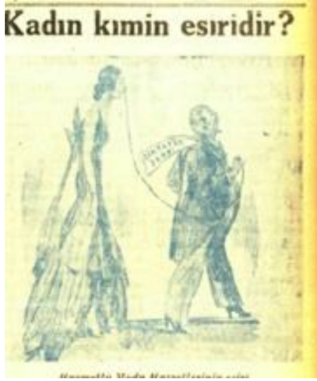
Haşmetli moda hazretlerinin esiri....

Yapılan yorumda, Mazhar Osman Bey'in sözlerinin kadınları pek hiddetlendirdiğini ancak bu münakaşayı doktorun kazanacağına inandıklarını ifade etmişlerdir. 61