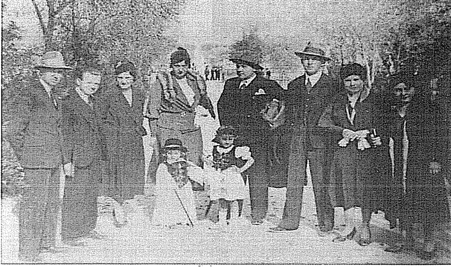
Foto. 3: Ankara Gazi Orman Çiftliği'nde çalışan Macar uzmanlardan birkaçı (1933)