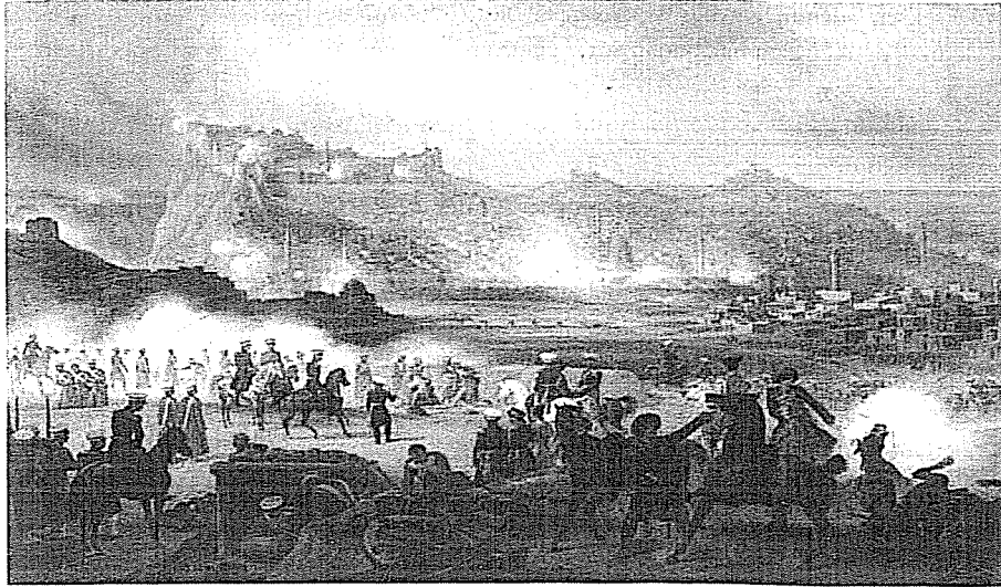
Resim 2: 28 Haziran 1828'de Rusların Kars Kalesine Saldırısı. Ressam Yaroslav Çuhodolskiy tarafından 1839'da tamamlanmıştır. Yağlı boya aslı St.Peterburg Askeri Tarih Müzesi'ndedir.