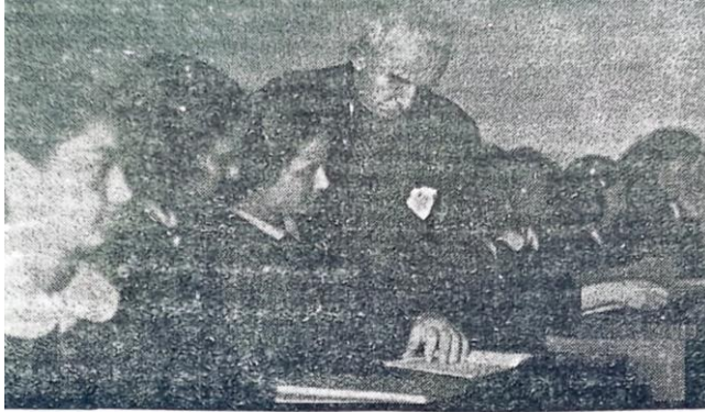
Ek 2- İsmet İnönü'nün İzmir Kız Lisesi'ni ziyaretinden bir kare

( Örnek Hayatlar: Vedide Baha Pars, Hayatı Makaleleri Konuşmaları , Cilt II, Der. Cahit Pars, Amerikan Board Neşriyat Dairesi, İstanbul, 1962)