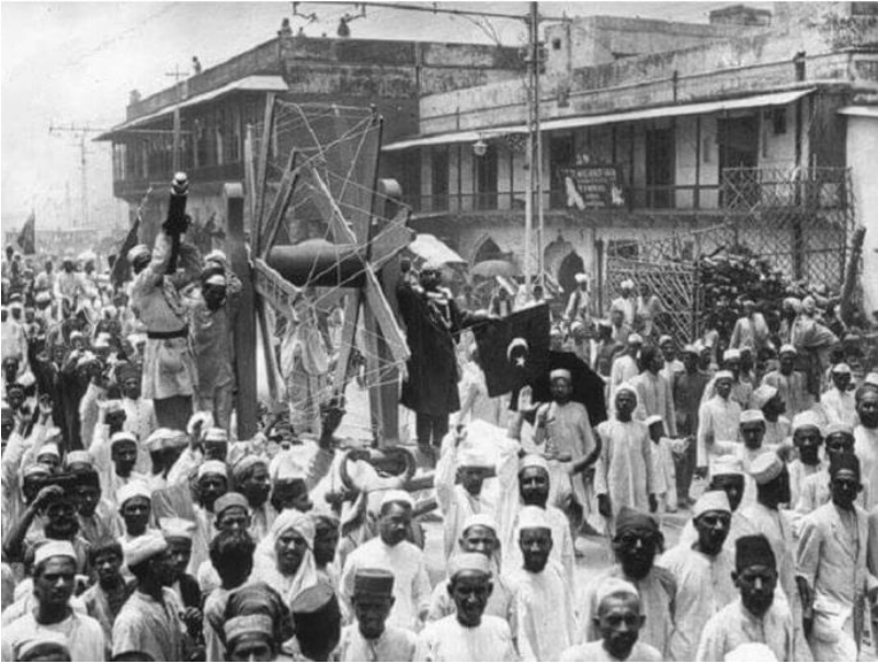
Resim 3 ve 4 - Millî Mücadele sırasında Hint Müslümanlarının Hindistan'ın çeşitli şehirlerinde düzenledikleri Türkiye'ye yardım kampanyaları