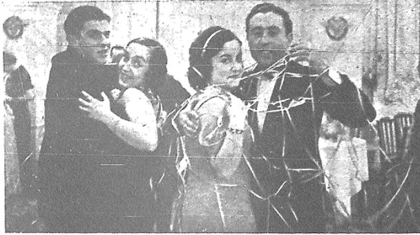
Tayyareci Vechi balosu geçen hafta İstanbulun büyük otellerinin birinde verildi. Resmimiz baloda dans eden neşeli çiftleri gösteriyor.